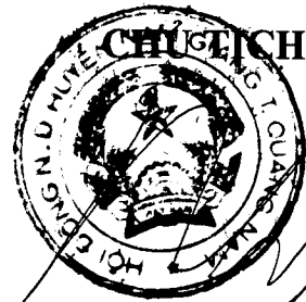
Chờ Rum Nhiên